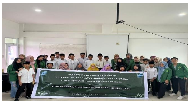
Gambar 3. Foto Bersama Para Dosen dan Mahasiswa UNUSU, Guru beserta Siswa SMP NU Medan