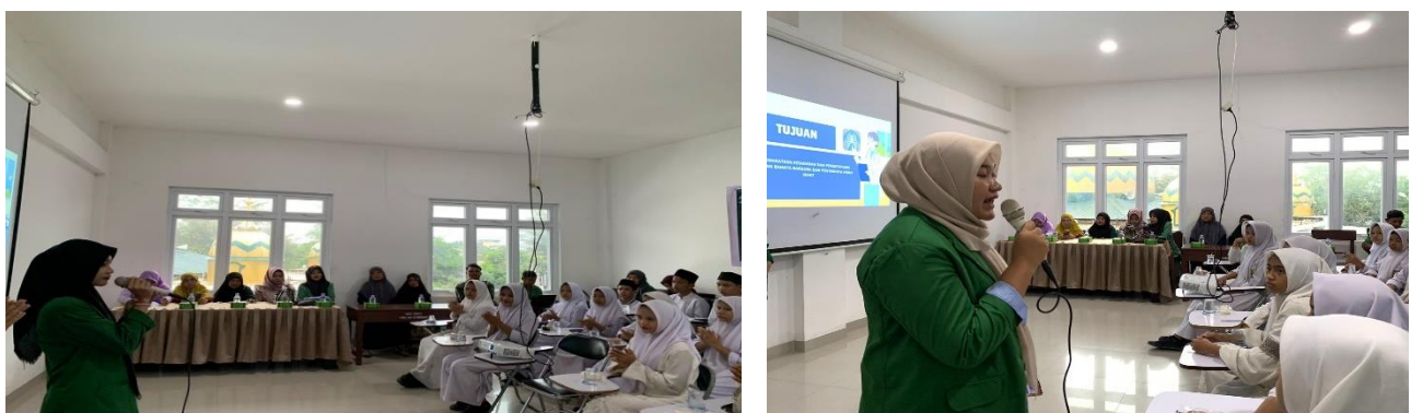
Gambar 1. Mahasiswi UNUSU memberikan materi mengenai Edukasi Perilaku Hidup Sehat Tanpa Narkoba