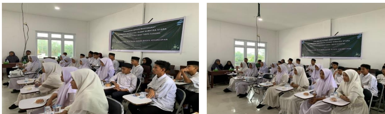
Gambar 2. Siswa mendengarkan materi mengenai Edukasi Perilaku Hidup Sehat Tanpa Narkoba yang disampaikan oleh Mahasiswa/i UNUSU